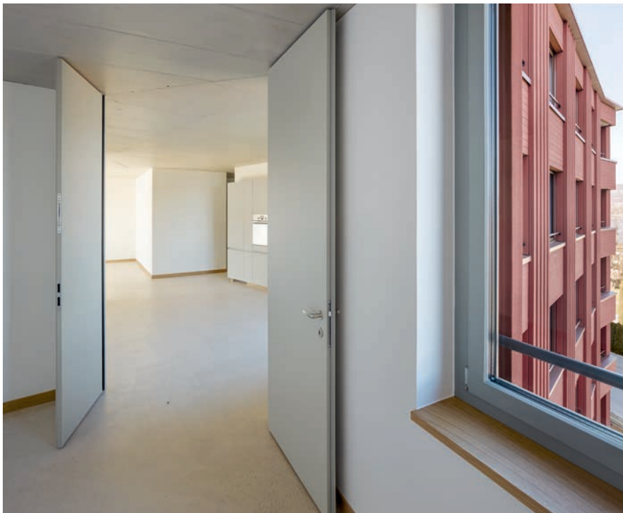
Fließende Wohnraumfolge: Wie private Inseln liegen die Zimmer im Meer des Kollektiven.