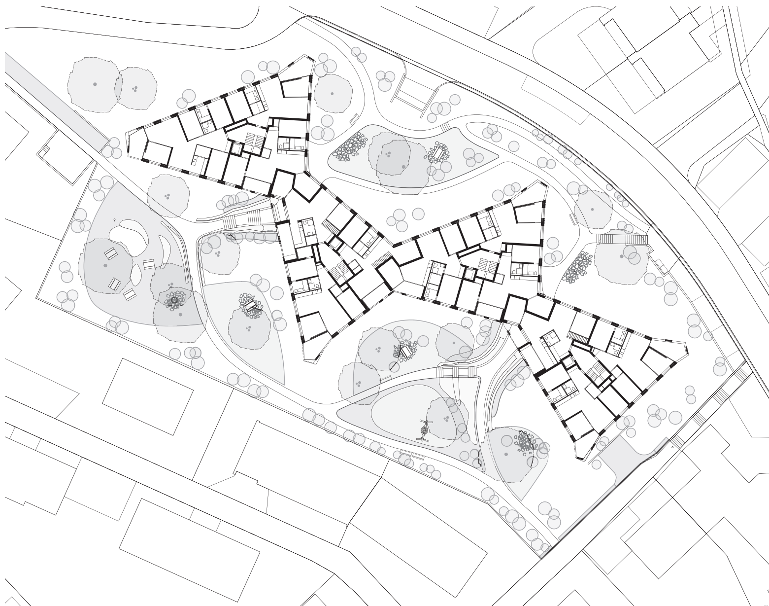
Erdgeschoss und Umgebung: Geschlungene Wege zonieren den Freiraum und erschliessen den Baukörper an den schmalen Taillen.