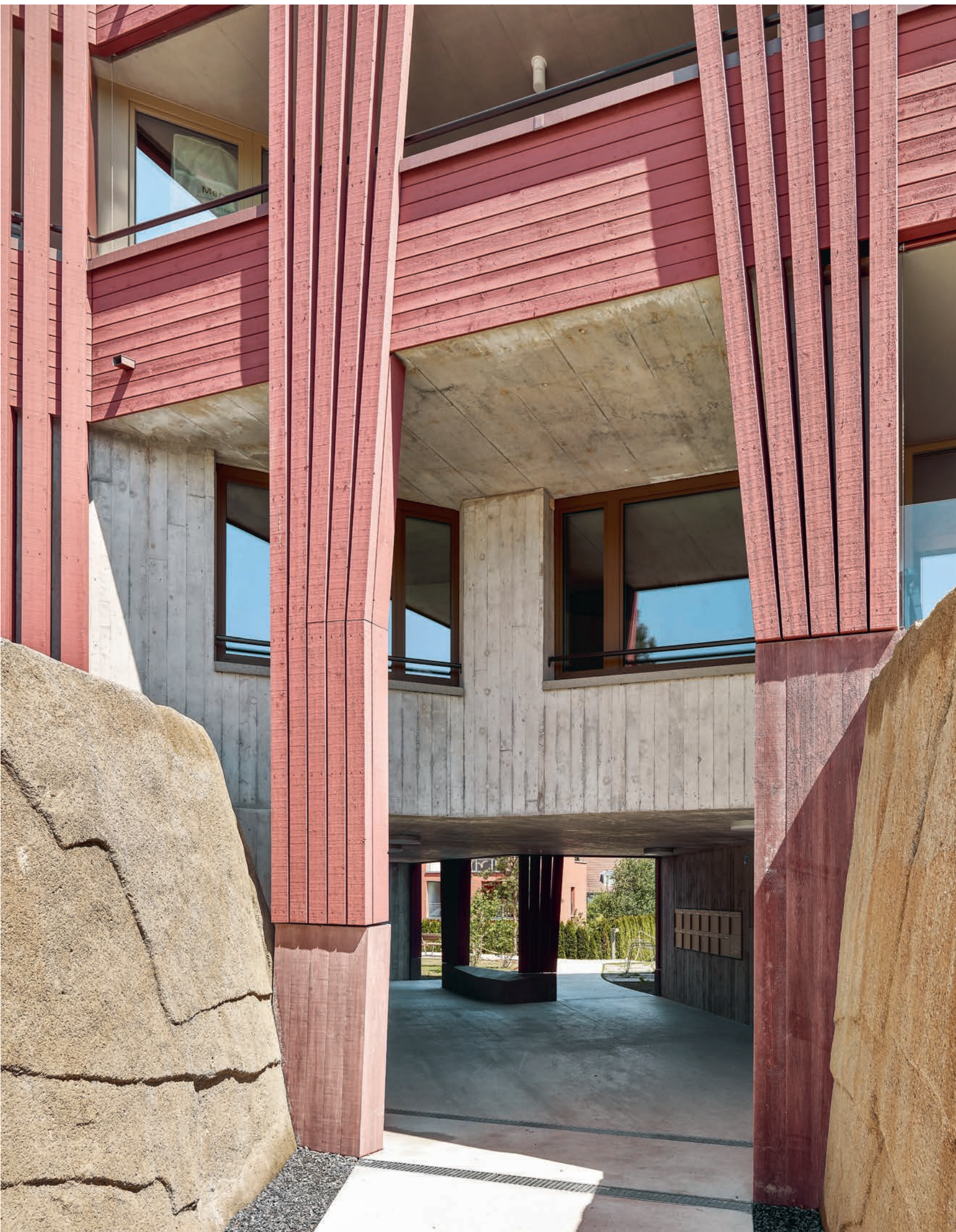
Neudorfstrasse in Wädenswil: Zwischen unbeholfenen Kunstfelsen führt der Weg zur Gebäudedetaille, die Fassade zieht sich wie ein Vorhang zur Seite. Foto: Roland Bernath