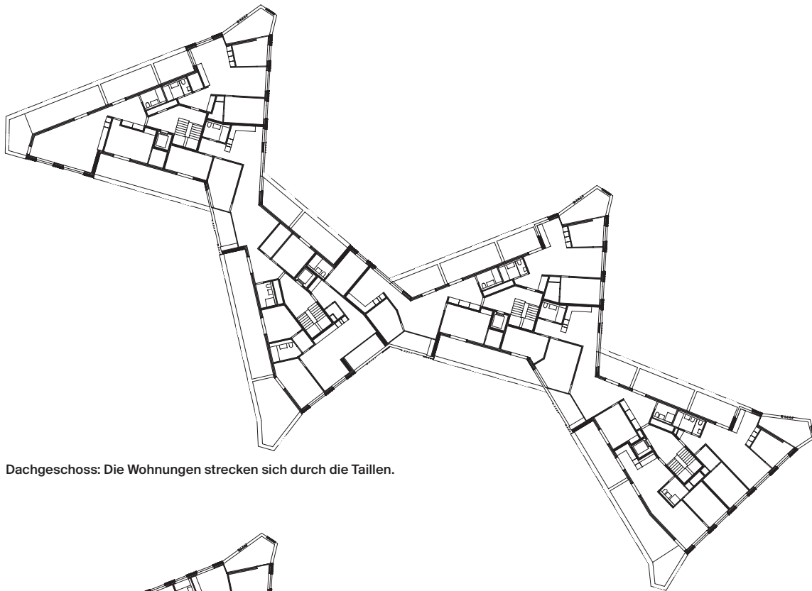
Dachgeschoss: Die Wohnungen strecken sich durch die Tailen.