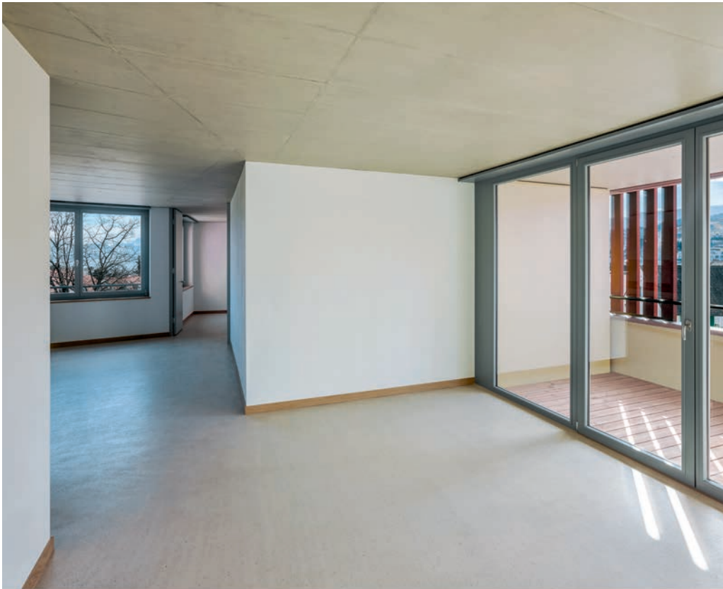
Die verwinkelten Grundrisse ermöglichen mehrseitigen Ausblick, Blickbezüge und lassen die Wohnungen grösser scheinen als sie sind.