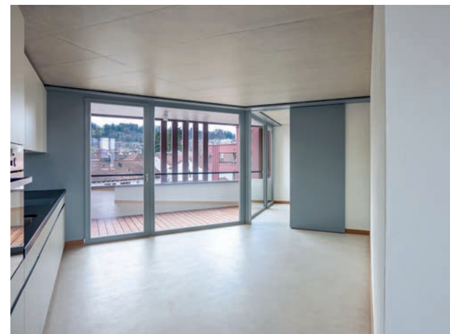
Schiebetüren machen das Zimmer zur Wohnraumerweiterung.