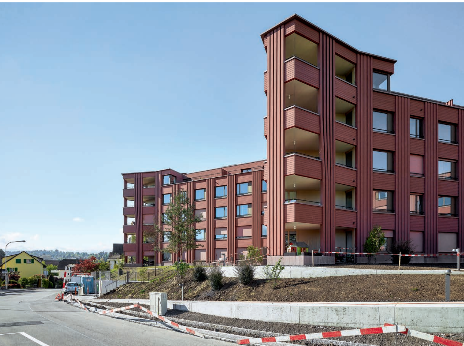
Das zergliederte Volumen fächert sich der Strasse entlang auf und scheint kleiner, als es ist.

→ hölzernen Hülle. Nun bildet ein Relief aus vertikalen, kräftig profilierten Streifen und zurückversetzten, glatten Horizontalflächen die Fassadenhaut. Das hinterlüftete Holzwerk aus Fichte ist in dunklem Falunrot lasiert, einer mineralischen Dickschicht mit Eisenoxid-Pigmenten, bekannt von schwedischen Holzhäusern. Sie haftet hervorragend auf sägerohem Holz, ist schädlingsresistent und kontrastiert mit der grünen Umgebung.